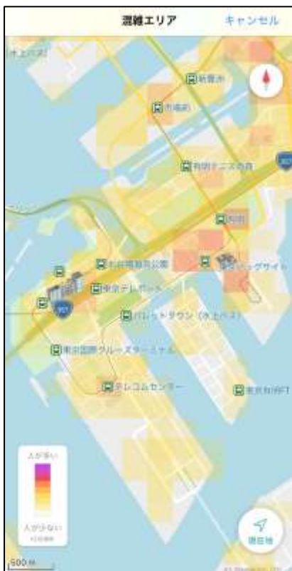
混雑エリアマップ

目的地までのルート検索結果に、電車の混雑予測を4段階のアイコンで表示します。また、通常のルート検索結果に加え、シェアサイクルを使った自転車のルートや、混雑を回避できるルートがある場合は「混雑回避ルート」を提案します。