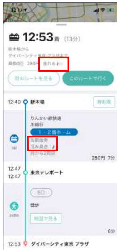
ルート詳細画面 (混雑度表示)