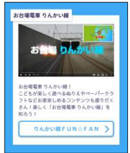
各施設のコンテンツ画面イメージ